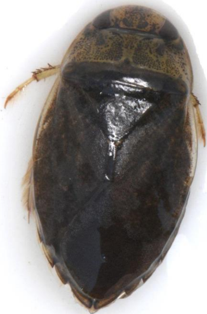
Platte waterwants, Zurich 8 juli 2023