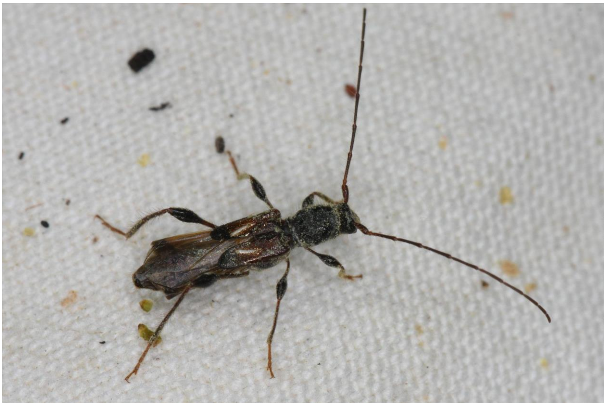
Naaldkortschildboktor, Pauwenburgsbos 20 mei 2023 (Gerben Mensink)

Boktorren zijn (vaak) grote en aansprekende keversoorten. In 2022 organiseerde de Insectenwerkgroep een boktorrenexcursie naar het Pauwenburgsbos in Oranjewoud. Net als voor veel andere bosgebieden in Friesland waren er nauwelijks waarnemingen bekend van boktorren in dat gebied. Tijdens die excursie vonden we elf soorten. Omdat we met één excursie maar een deel van het Pauwenburgsbos konden doen vermoedden we dat er nog meer te vinden zou moeten zijn. Om een zo volledig mogelijk beeld te krijgen van diversiteit aan boktorren van dat bosgebied besloten we om dit verder te gaan onderzoeken. Het doel van het onderzoek is dus het in kaart brengen van de diversiteit aan boktorren in het Pauwenburgsbos. In totaal zijn er drie excursies (waarvan een late-avond/nachtexcursie) en vier 'pop-upexcursie' naar het gebied georganiseerd. Inmiddels staat het aantal gevonden boktorren op vijftien soorten. Hierbij zitten een aantal zeldzame tot zeer zeldzame zoals de Bloedrode smalboktor ( Anastrangalia sanguinolenta ), de Gewone dubbeloogboktor ( Tetropium castaneum ) en de Doffe dubbeloogboktor ( Tetropium fuscum ). We hebben het idee dat er nog wel wat meer uit te halen moet zijn en daarom besloten het onderzoek met nog een jaar te verlengen. Inmiddels is er afgelopen winter wel grootschalig gekapt in het gebied. We zullen zien wat dat betekent voor het vervolg van de inventarisatie. Na afloop van het onderzoek willen we een artikel voor de Twirre schrijven.