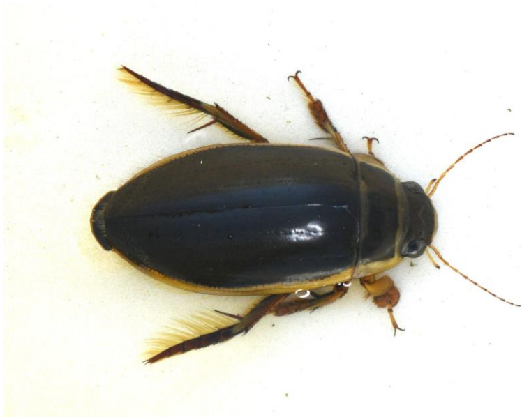
Gewone geelrand, Zürich 8 juli 2023 (Gerben Mensink)