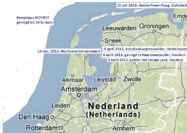
Figuur 3. Kemphaan W7YRY, geringd op 6 april 2013.

de Hoants op 25 juli 2013 uit Hauke-Haien-Koog in het Duitse Waddengebied. Verleidelijk om te veronderstellen dat de vogel onderweg was naar een noordelijk broedgebied. In ieder geval zit hij nu weer wat zuidelijker. Wie weet blijft de Hoants met zacht weer én met voldoende voedsel deze winter in Nederland.