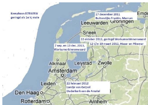
Figuur 2. Kemphaan B7RWRW, geringd op 22 oktober 2011.

'Onze' Kemphaan van 13 december 2013 op de Workumerbinnenwaard was ruim twee jaar eerder, op 22 oktober 2011, in hetzelfde gebied als 1 e kj vogel gevangen en geringd (figuur 2). Krap twee maanden na de vangst is het dier langs de Friese waddenkust gezien. Nog eens twee maanden later is de Hoants in het Landje van Geijssel bij Ouderkerk aan de Amstel gesignaleerd. Drie weken later zat hij al weer noordelijker, nu bij het Hisse- en Pikemeer. De daaropvolgende twee broedseizoenen is de vogel niet teruggemeld. Op 7 september 2013 is hij voor het eerst weer gezien, net als op 13 december in de Workumerbinnenwaard. De Kemphaan van 14 december 2013 was ongeveer acht maanden eerder, op 6 april 2013, als 2 e kj vogel in de Haanmeerpolder bij Koudum gevangen en geringd (figuur 3). Na nog enkele dagen in het ringgebied gezien te zijn, kwam de eerstvolgende terugmelding van