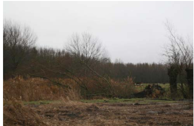
Het noodlot van een klein slaapplaatsje; de omgewaaide slaapboom van Aalscholwers aan de Jelsumerfeart bij Leeuwarden.

Ook het overzicht van de aalscholwerslaapplaatsen is niet helemaal volledig, maar opmerkelijk is hoezeer de