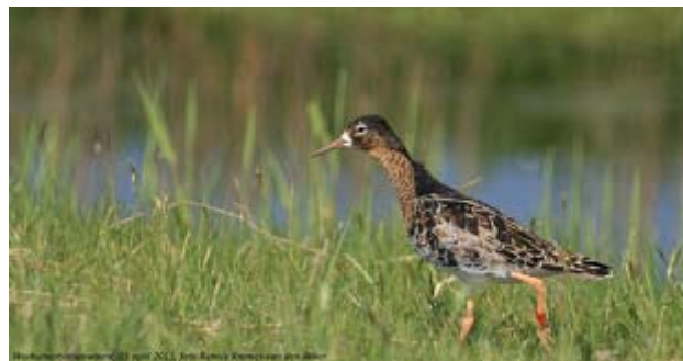
Adulte, gekleurringde Kemphaan op de Workumerbinnenwaard, 23 april 2011.

Hierna een korte terugblik op de 'roofvogels' en op 'het kleine grut' van de Extra Soorten, die tijdens de