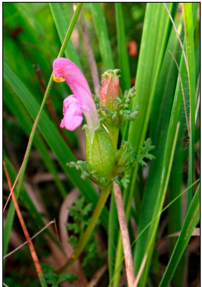
Figuur 1. Heidekartelblad, Rottige Meente 2 juni 2012.

Door middel van literatuuronderzoek en navraag bij beheerders is nagegaan waar de soort nog in het Laagveendistrict voorkomt. Beide auteurs hebben vegetatieopnamen van begroeiingen met Heidekartelblad gemaakt (opnameschaal Braun-Blanquet, tabel 2). Het merendeel van deze opnamen is in 2016 gemaakt door de eerste auteur. Daarnaast zijn er vier opnamen gebruikt die gemaakt werden in het kader van excursies door de Plantensociologische Kring Nederland. Deze laatste vegetatieopnamen zijn reeds eerder gepubliceerd in Weeda (2002, 2004). De in totaal 26 opnamen zijn in