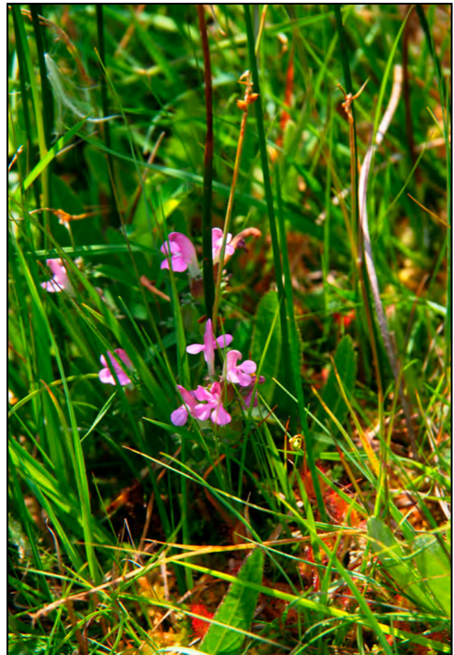
Figuur 3. Heidekartelblad in blauwgrasland met onder meer Spaanse ruiter, Blauwe zegge, Paddenrus en Ronde zonnedauw, Rottige Meente opname 2 4 juli 2016.

De in tabel 3 gepresenteerde vegetaties zijn opgebouwd uit een lage kruidlaag, een ijlere hoge kruidlaag en een doorgaans erg goed ontwikkelde moslaag (zie