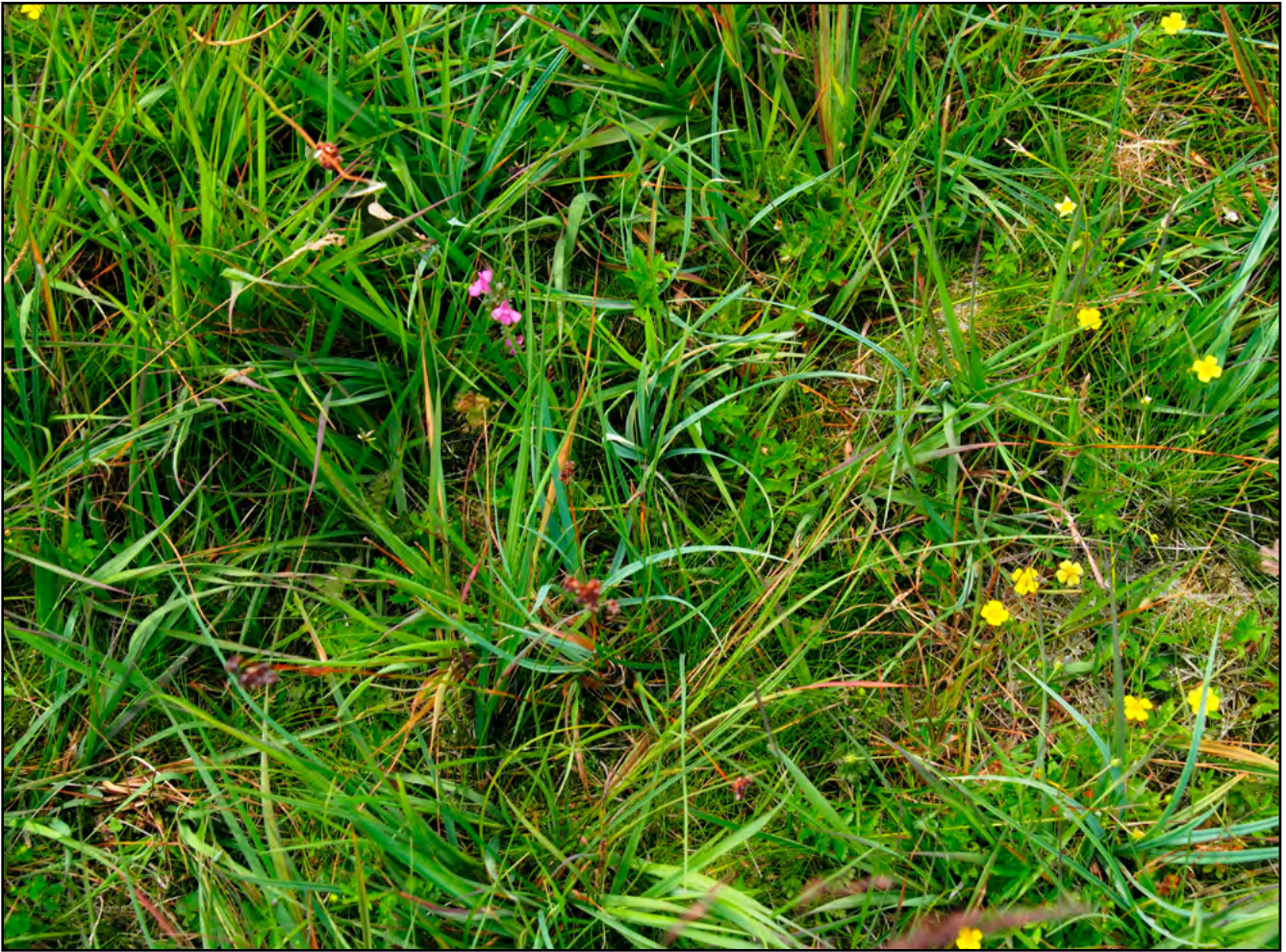
Figuur 4. Heidekartelblad in heischraal grasland met onder meer Borstelgras, Biezenknoppen, Veelbloemige veldbies, Tormentil, Blauwe zegge en Tandjesgras, Easterskar 7 juli 2016.

grasland ook in blauwgrasland en vochtige heiden voorkomt. Biezenknoppen ( Juncus conglomeratus ), Veelbloemige veldbies ( Luzula multiflora ) en Blauwe knoop herinneren mogelijk aan het blauwgrasland van weleer. PQ1 en PQ2 zijn in 2014 ook op te vatten als de associatie van Klokjesgentiaan en Borstelgras.